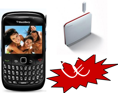
Blackberry 8520 + Router

Todo por 59.90 29.90 Durante los 2 primeros meses