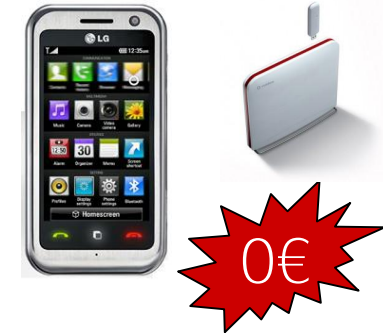
LG Arena + Router

INTERNET SIEMPRE CONTIGO ADSL 6 Mb sin Límite + Tarifa Plana Navegación desde USB (4GB/mes) + Plan Todo en Uno con Tarifa Plana a Fijos Nacionales y entre los móviles de la empresa + Número fijo portado