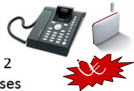
Neo 3000 + Router

Todo por 59.90 29.90 Durante los 2 primeros meses