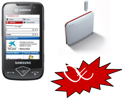
Samsung Blade + Router

Internet siempre contigo (adsl + modem usb) + Voz Fija y Móvil y te regalamos el ADSL de por vida: